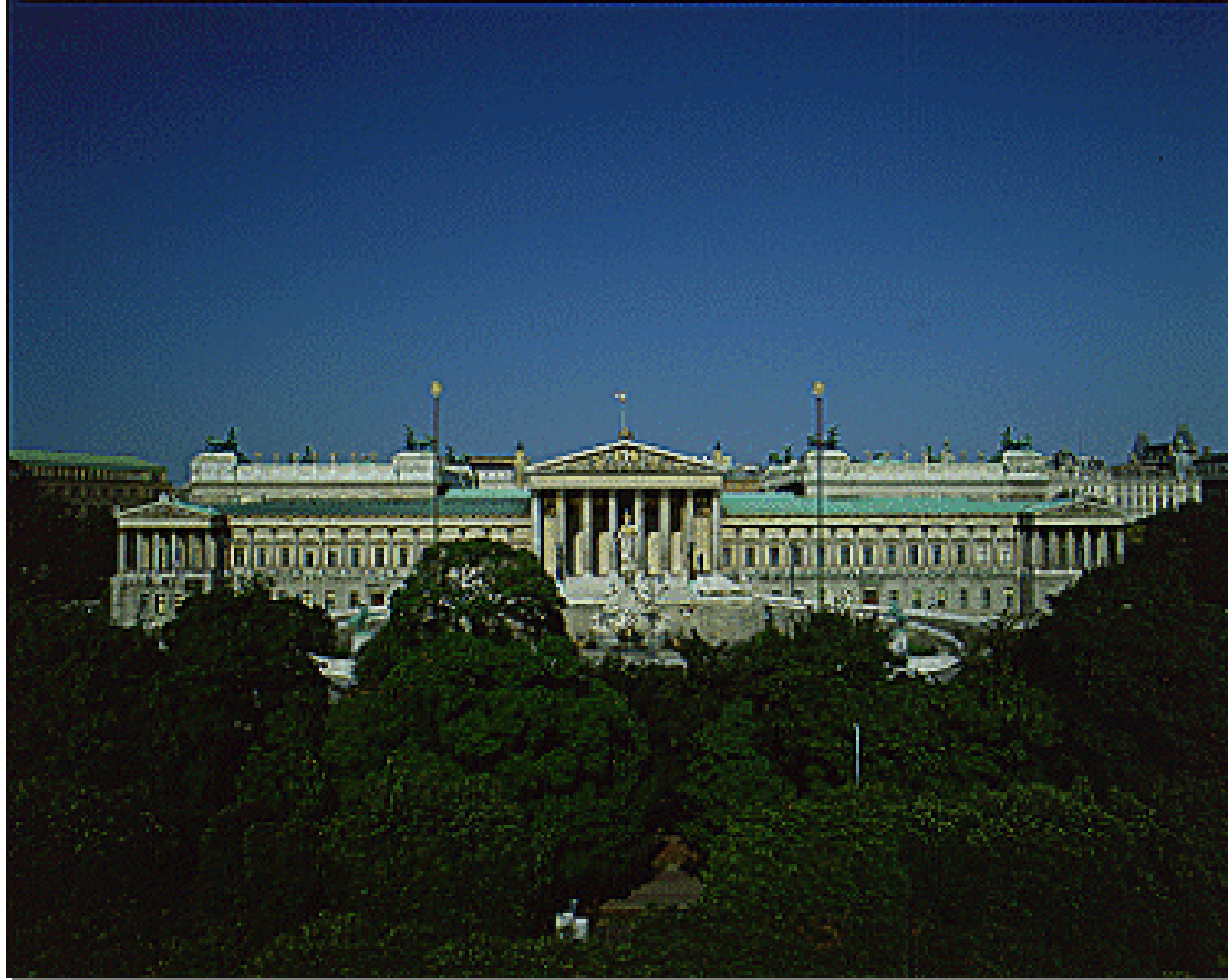
Foto: sede do Parlamento Austríaco