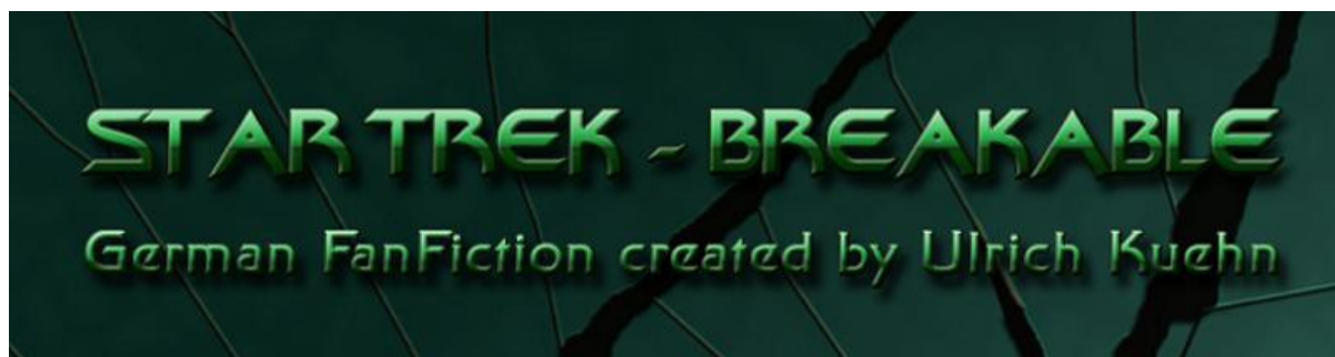
STAR TREK - BREAKABLE