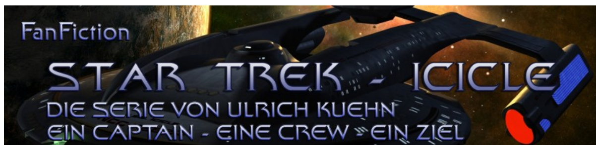
STAR TREK - ICICLE