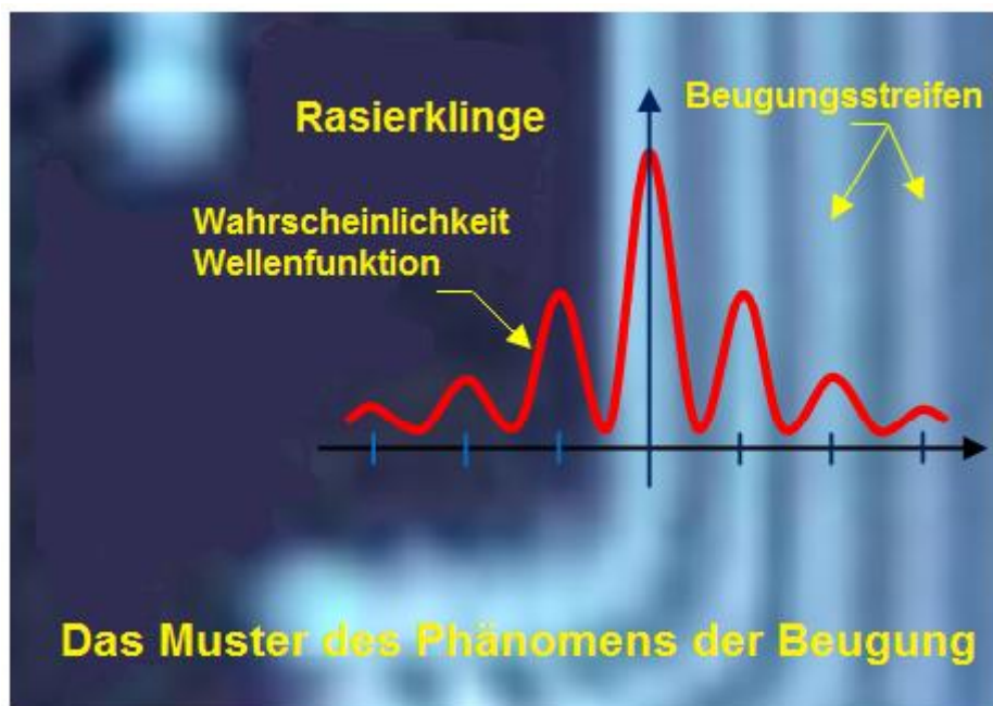
Bild 2- Ein echtes Muster der Beugung oder Streuung von Photonen

Ein echtes Muster der Beugung oder Streuung von Lichtteilchen ist in bild 2 dargestellt: