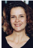
SESTUS: Angelika Kirchschrager (Mezzo-soprano)