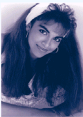
CLEOPATRA: Danielle de Niese (Soprano)