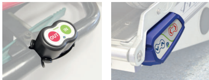
Doppio azionamento con telecomando e pulsantiera fissa.