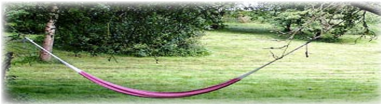
Wozu dient dieser Schritt?

Es ist egal, worum es sich handelt, solange es etwas ist, das positive Gefühle in Ihnen wachruft.