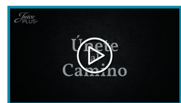
Únete al Camino http://player.vimeo.com/video/531990703