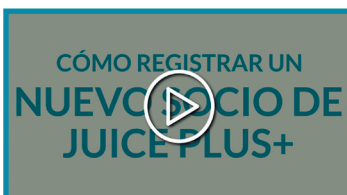
Cómo Registrar a un Nuevo Socio http://player.vimeo.com/video/531940551