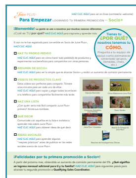
Lista de Verificación Para Empezar de Socio+ http://bit.ly/Para_Empezar_1